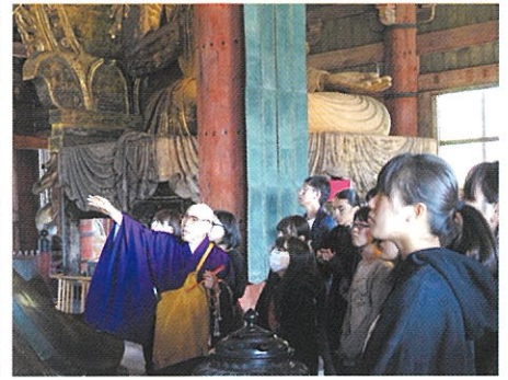
登壇して大仏様に作品の奉納